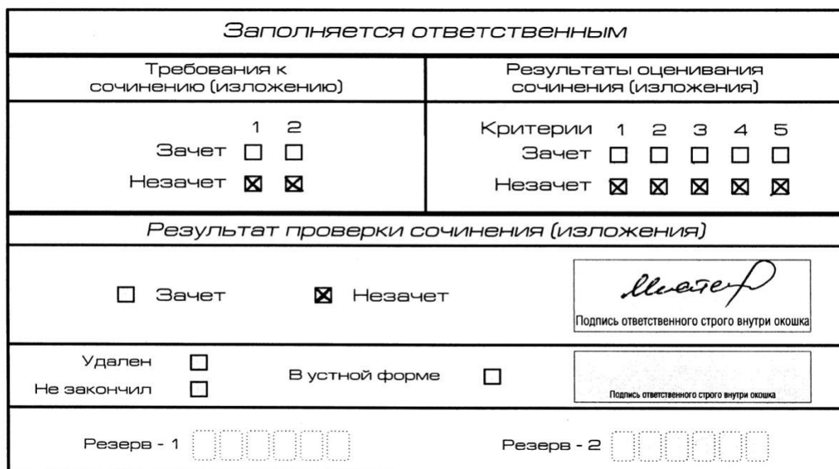
Рис. 6. Область для оценки работы