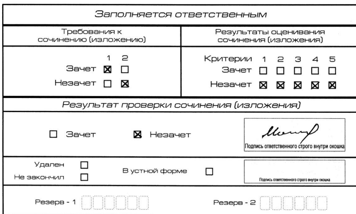
Рис. 7. Область для оценки работы

Если итоговое сочинение (изложение) соответствует требованию № 1 и требованию № 2, то выставляется «зачет» за выполнение требования № 1 и требования № 2. Указанные сочинения (изложения) далее оцениваются по критериям.