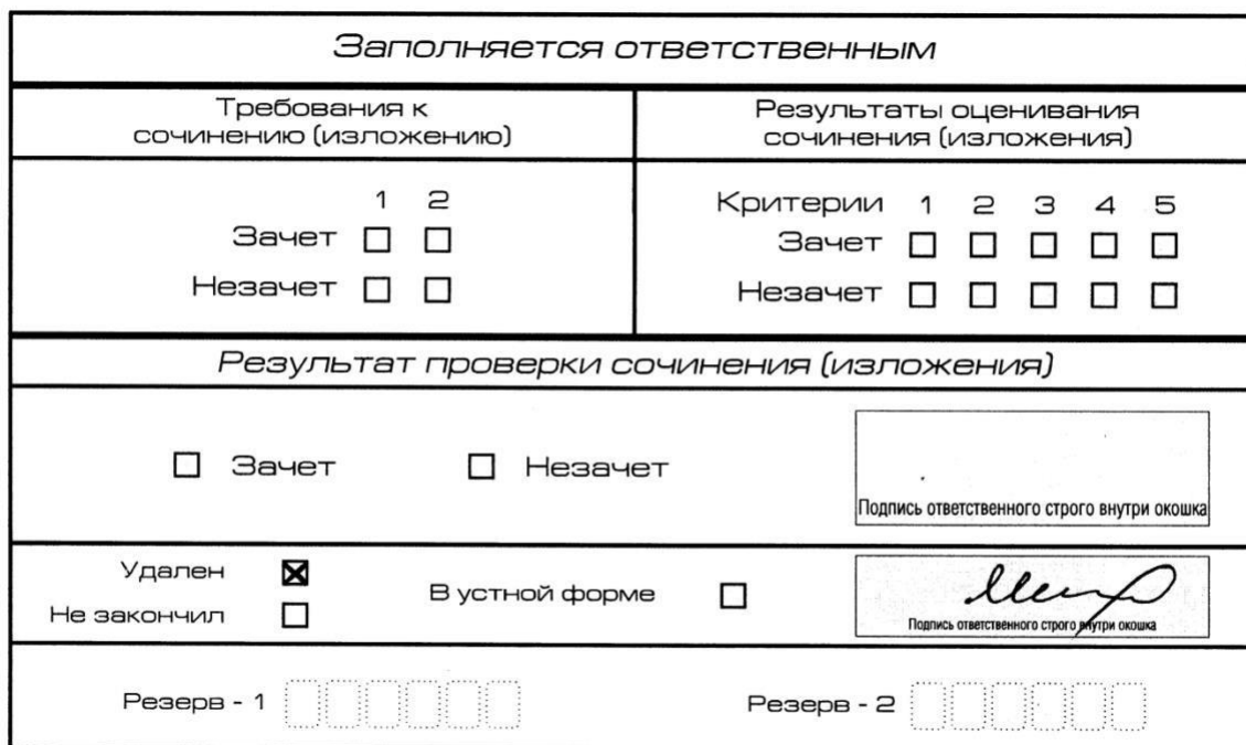
Рис. 11. Заполнение полей нижней части бланка регистрации (удаление с экзамена)