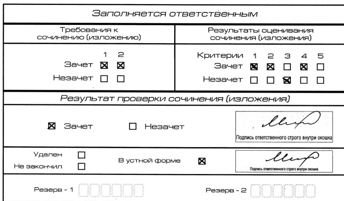
Рис. 9. Область для оценки работы сочинения (изложения) в устной форме

После окончания заполнения бланка регистрации ответственное лицо ставит свою подпись в специально отведенном для этого поле.